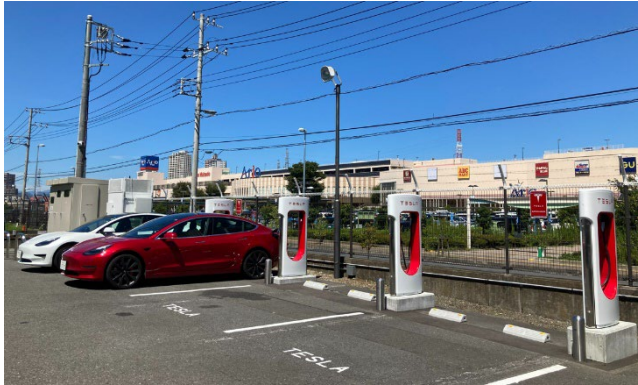
TESLA 電気自動車用スーパーチャージャー