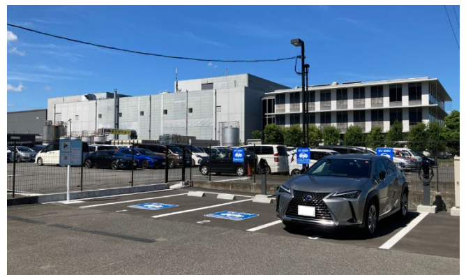
電気自動車用普通充電設備